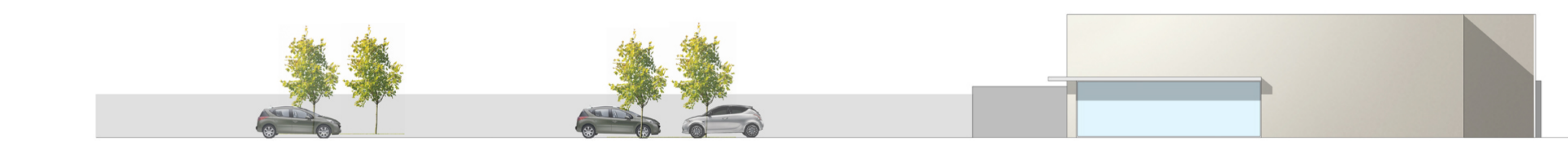
Prospecto Est Vista 4-4 scala 1:200