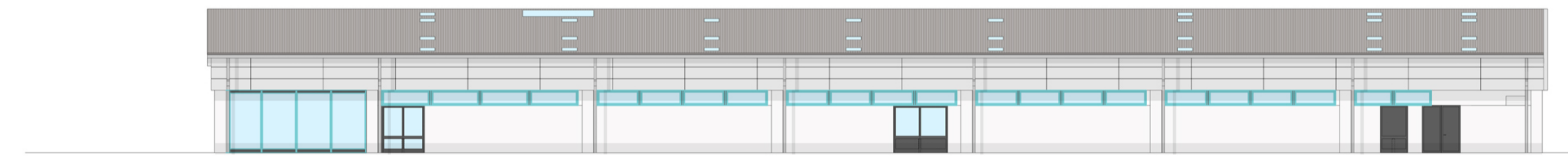
Prospecto Est Vista 3-3 scala 1:200