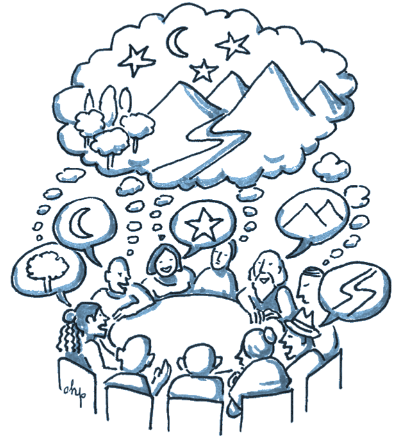
Illustrazione di Chiara Pignaris per la Carta della Partecipazione (licenza CC BY)