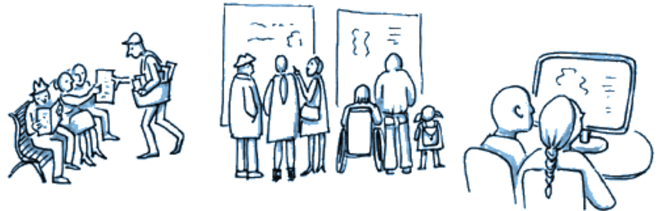
Illustrazione di Chiara Pignaris per la Carta della Partecipazione (licenza CC BY)