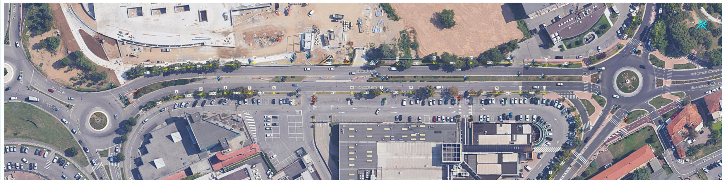
Via Salgari - visione d'insieme 1:500