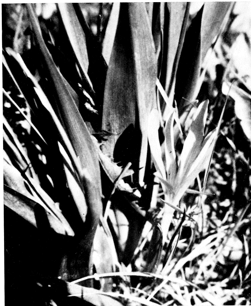
Fig. 3 - Il preteso Bulbocodium vernum della valle di Ledro, qui ritratto l'11 maggio 1961, era invece semplicemente un esemplare di Colchicum autumnale L. nella fo. vernum (Schrank).

bocodium per una località montana in destra della val di Ledro, su affrettata segnalazione di persona non del tutto preparata alle sottigliezze della biologia botanica, imbattutasi ai primi di maggio dell'anno innanzi in un gruppetto di Colechici in fiore.