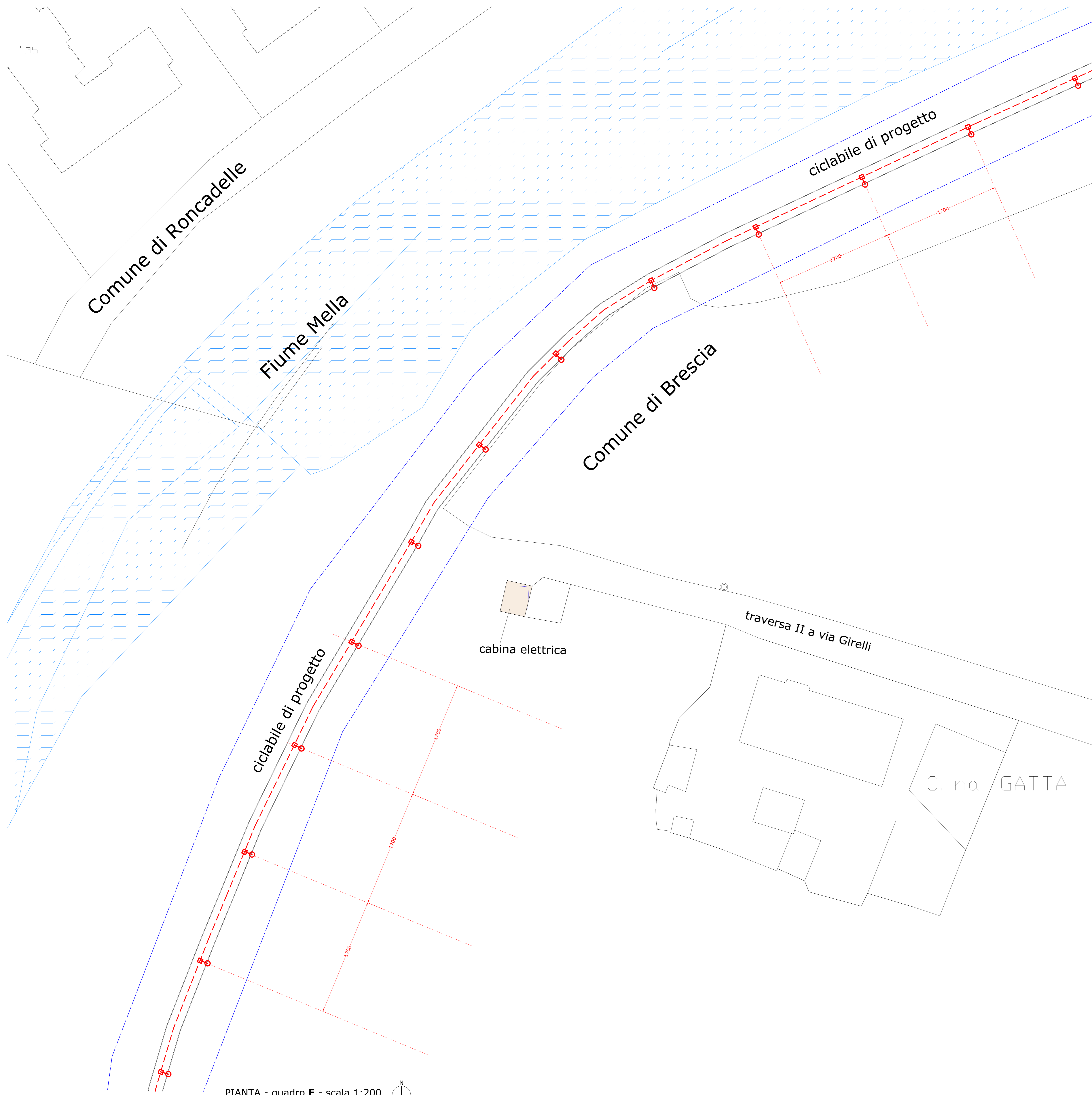
PIANTA - quadro E - scala 1:200